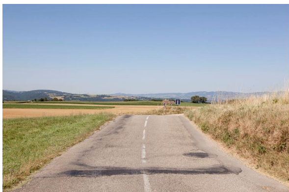
Yann de Fareins, Chasse-Sur-Rhone – Cornavent, 2016.